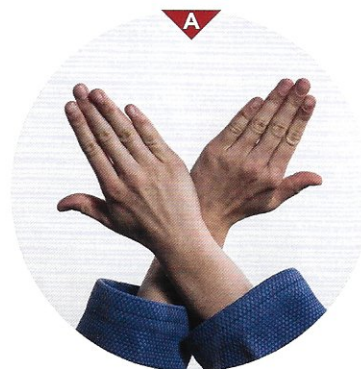
Bild A zeigt dir genau die Haltung der Hände. Die Daumen beider Hände greifen in die Jacke von Uke, die Finger bleiben außen. Die Haltung der Hände ist also „normal“ (nami). Greife mit beiden Händen tief in den Kragen von Uke. Beim Würgen ziehst du die Ellbogen auseinander und drückst mit deinen Handkanten gegen den Hals von Uke.