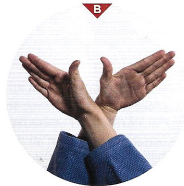
Bild B zeigt dir genau die Haltung der Hände. Beide Handflächen bzw. Daumen zeigen nach oben. Die Position der Hände ist also „verkehrt oder umgekehrt“ (gyaku). Greife ebenfalls mit beiden Händen (Finger innen) tief in Ukes Kragen und würge, indem du beide Ellbogen auseinanderziehst.